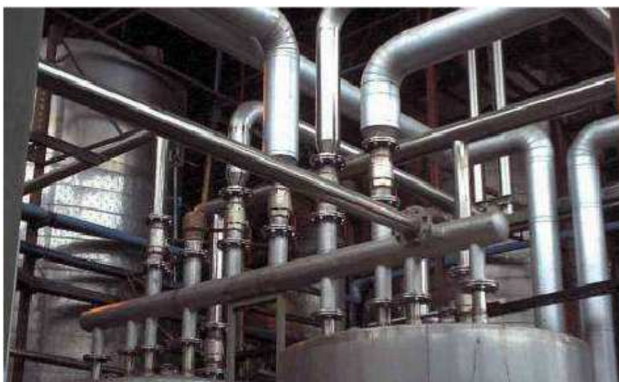
Sala cocimiento Planta cervecera C